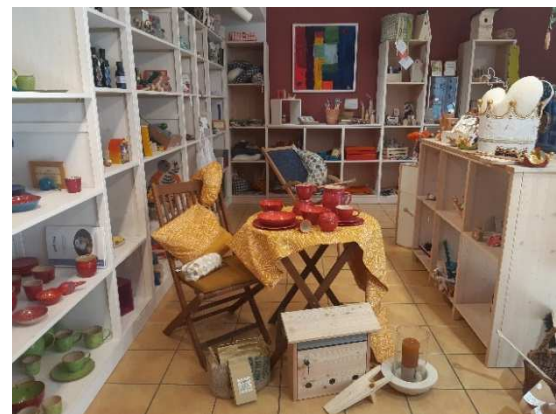
Der Herzogsägmühler Laden in Weilheim

Und was schätzt unsere Kundschaft? Vor allem unser buntes Sortiment mit einer großen Auswahl an liebevoll hergestellten Waren - inklusive fundierter, individueller Beratung.