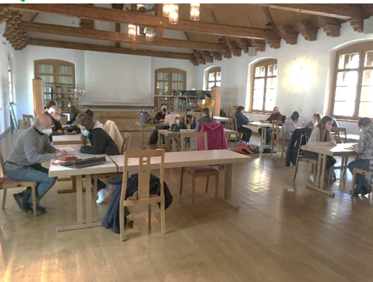
Einblicke in den Fragenachmittag

Der Umgang mit digitalen Medien ist für Ungeübte oft kompliziert und schwer durchschaubar. Deshalb hatte der Seniorenbeirat der Stadt Schongau in Zusammenarbeit mit Schülern der Pfaffenwinkel-Realschule mehrere Nachmittage Fragen zu mitgebrachten digitalen Endgeräten beantwortet. Es wurden rege Tipps und Hinweise durch die engagierten Jugendlichen eingebracht und das Interesse bei den Besuchern war groß. Eine Fortsetzung im neuen Schuljahr wird überlegt.