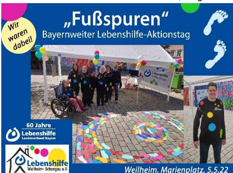
Die Fußspuren auf dem Weilheimer Marienplatz